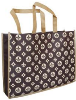
Lilie Eleganza klein