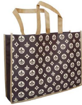
Lilie Eleganza Maxi