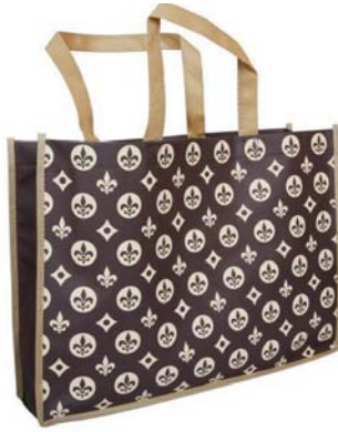
Lilie Eleganza mittel