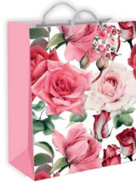
1617 The Fairy