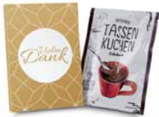
Vielen Dank 2K1357e