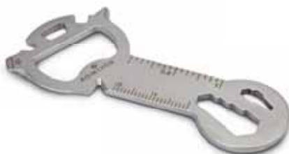
Key Tool Snake (18 Funktionen) Endung „c“