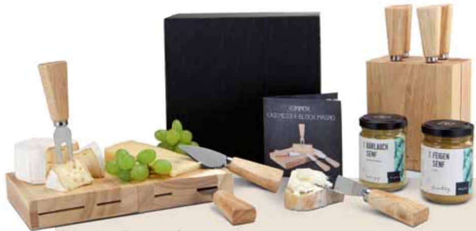
Käse nur Deko

Servieren Sie Käse geschmackvoll und praktisch zugleich. Dieses Käse-Trio enthält ein innovatives ROMINOX® Käsemesser-Set inklusive Block und je 145 g Bärlauch- und Feigensenf im Glas. Der Block dient stehend zur Aufbewahrung der 4 Käsebesteckteile und ist liegend ein flexibles Käsebrett (die zwei Hälften haften magnetisch aneinander). Ein Infolyer beschreibt die beiden Senf-Varianten sowie den Einsatz des Käsemesserblocks. Alles zusammen in einem schwarzen Karton – Fromage savoureux!