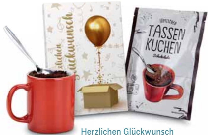
Herzlichen Glückwunsch 2K1357g