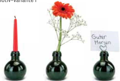
Anwendungsbeispiel für eine nachhaltige Verwendung

Kleinste Sektflasche ohne Geschenkkarton 2K1540