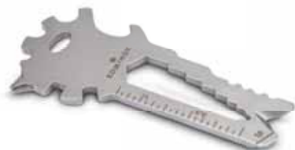
Key Tool Lion (21 Funktionen) Endung „b“

Kombinieren Sie Ihr Wunsch-Mäppchen mit Ihrem Wunsch-Key Tool