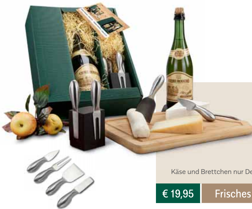
Käse und Brettchen nur Deko