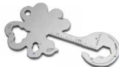
Key Tool Lucky Charm (19 Funktionen) Endung „m“

Werben Sie mit praktischen Multifunktionsstools als Schlüsselanhänger. Mit den kleinen Begleitern von ROMINOX® sind die praktischsten Werkzeuge wie Schraubenzieher, Lineal oder Sechskantschlüssel immer dabei, egal ob im Alltag, im Büro oder auf Reisen. Wählen Sie aus verschiedenen Tools und Mäppchen mit Motiv-Aufdruck (inkl. Einleger mit Funktionsbeschreibung). Auf Wunsch auch mit Gravur oder Mäppchen im Eigendesign.