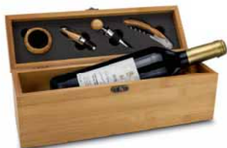
€ 24,95 Buche-Block mit Wein 2K1438

Eine hochwertige Bambuskiste mit edlen Weinaccessoires von ROMINOX® für einen guten Rotwein: Korkenzieher, Flaschenverschluss, Ausgießer und Tropftring, jeweils mit Bambuselementen. Dazu eine Flasche 0,75 l klassischer Cabernet Sauvignon mit hochwertiger Goldfolienprägung.