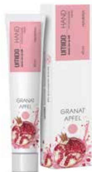
IHL00036 Handlotion mit Granatapfel-Extrakt