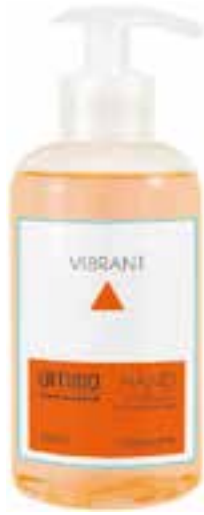
IU-NP-FSS-004 VIBRANT Flüssigseife mit Orangen- & Pinien-Extrakt