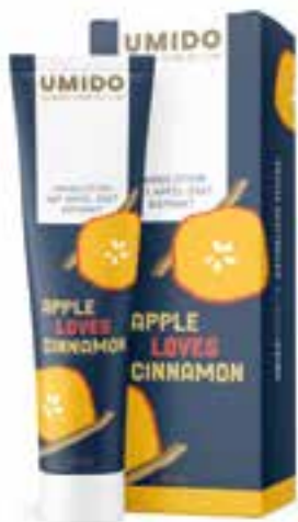
IHL00044 Handlotion mit Apfel-Zimt-Extrakt