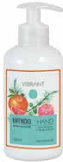
IU-NP-HLS-004 VIBRANT Handlotion mit Orangen- & Pinien-Extrakt