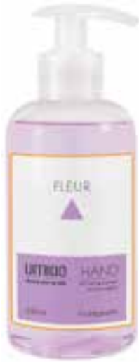
IU-NP-FSS-002 FLEUR Flüssigseife mit Honig-Extrakt & Lavendelöl