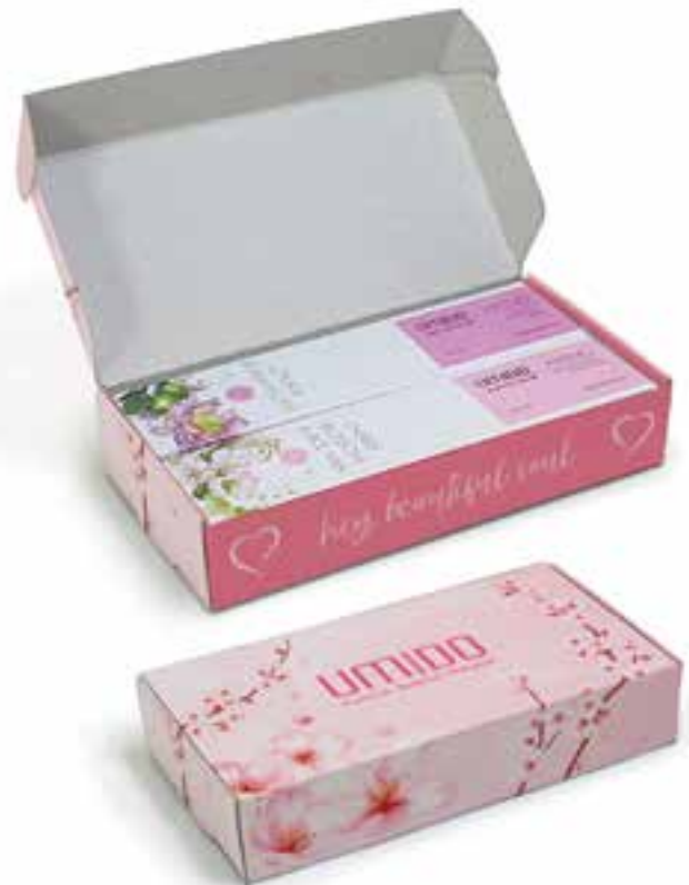
IUGB2002 GESCHENKBOX - KIRSCHBLÜTE