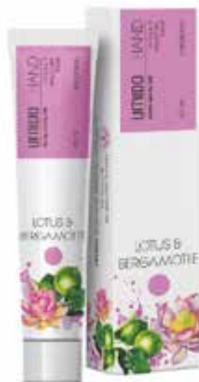
IHL00072 Handlotion mit Lotus- & Bergamotte-Extrakt