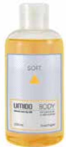
IU-NP-DG-016 SOFT Duschgel mit Calendula- & Milch-Extrakt