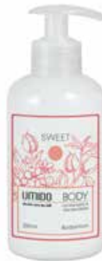
IU-NP-BLS-014 SWEET Bodylotion mit Mandelöl & Mandel-Extrakt