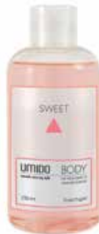
IU-NP-DG-014 SWEET Duschgel mit Mandelöl & Mandel-Extrakt