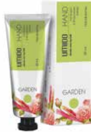
IUHC3006 GARDEN Handcreme mit Rosen- & Rhabarber-Extrakt