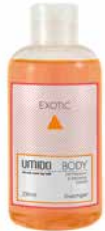
IU-NP-DG-008 EXOTIC Duschgel mit Papaya- & Hibiskus-Extrakt