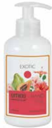
IU-NP-HLS-008 EXOTIC Handlotion mit Papaya- & Hibiskus-Extrakt