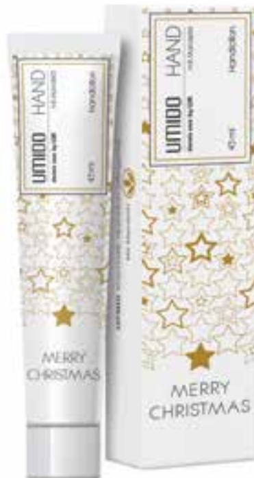
IHL00082 Handlotion mit Mandelöl