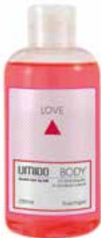
IU-NP-DG-010 LOVE Duschgel mit Granatapfel- & Orchideen-Extrakt