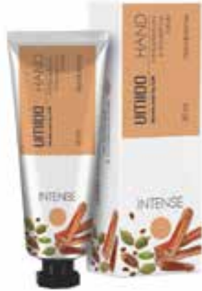
IUHC3012 INTENSE Handcreme mit Kardamom- & Sandelholz-Extrakt