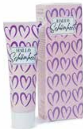
IUHC30018 HALLO SCHÖNHEIT Handcreme mit Mandelöl & Mandel-Extrakt