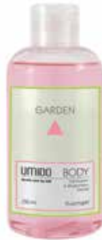
IU-NP-DG-006 GARDEN Duschgel mit Rosen- & Rhabarber-Extrakt