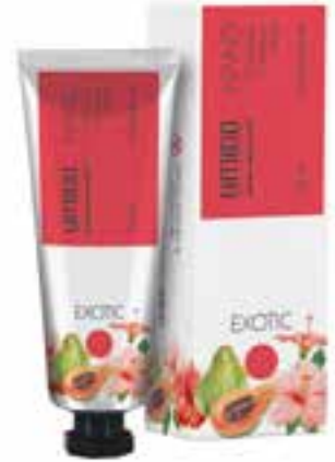
IUHC3008 EXOTIC Handcreme mit Papaya- & Hibiskus-Extrakt