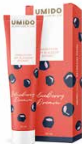
IHL00048 Handlotion mit Blaubeer-Extrakt