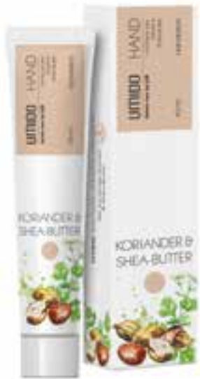
IHL00046 Handlotion mit Koriander-Extrakt & Shea-Butter