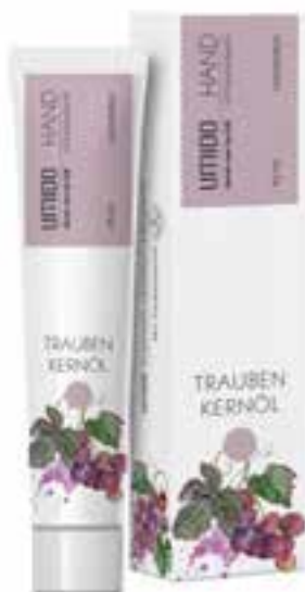
IHL00008 Handlotion mit Traubenkernöl