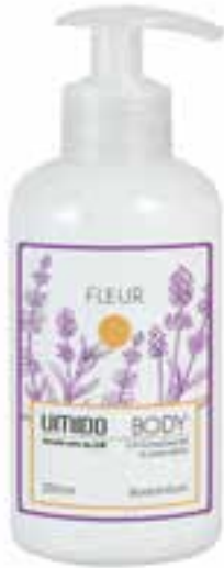
IU-NP-BLS-002 FLEUR Bodylotion mit Honig-Extrakt & Lavendelöl