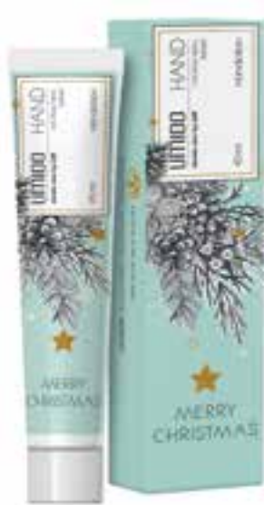
IHL00080 Handlotion mit Aloe-Vera-Extrakt