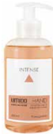
IU-NP-FSS-012 INTENSE Flüssigseife mit Kardamom- & Sandelholz-Extrakt