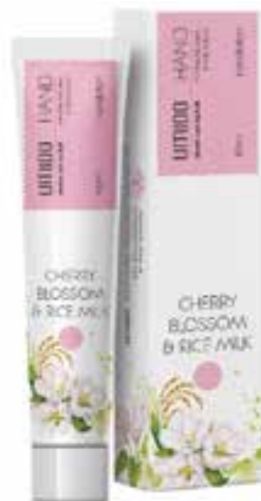
IHL00070 Handlotion mit Kirschblüten- & Reis-Extrakt