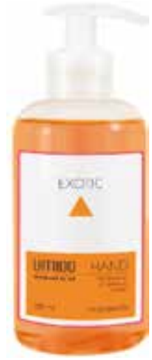
IU-NP-FSS-008 EXOTIC Flüssigseife mit Papaya- & Hibiskus-Extrakt