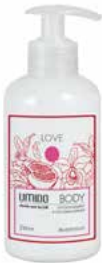
IU-NP-BLS-010 LOVE Bodylotion mit Granatapfel- & Orchideen-Extrakt