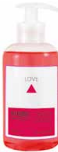
IU-NP-FSS-010 LOVE Flüssigseife mit Granatapfel- & Orchideen-Extrakt