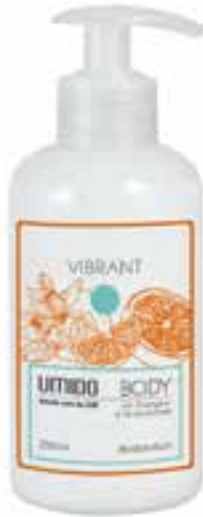
IU-NP-BLS-004 VIBRANT Bodylotion mit Orangen- & Pinien-Extrakt