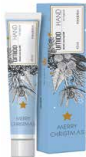
IHL00088 Handlotion mit Arganöl