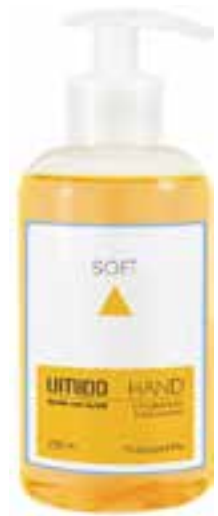
IU-NP-FSS-016 SOFT Flüssigseife mit Calendula- & Milch-Extrakt