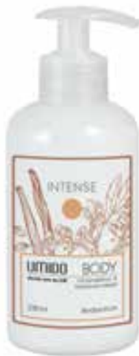
IU-NP-BLS-012 INTENSE Bodylotion mit Kardamom- & Sandelholz-Extrakt