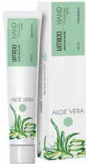
IHL00002 Handlotion mit Aloe-Vera-Extrakt