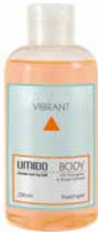
IU-NP-DG-004 VIBRANT Duschgel mit Orangen- & Pinien-Extrakt