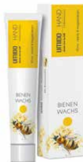
IHL00062 Hand- & Nagelbalsam mit Bienenwachs