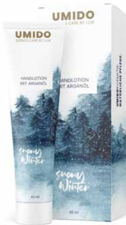
IHL00094 Handlotion mit Arganöl