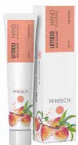
IHL00024 Handlotion mit Pfirsich-Extrakt