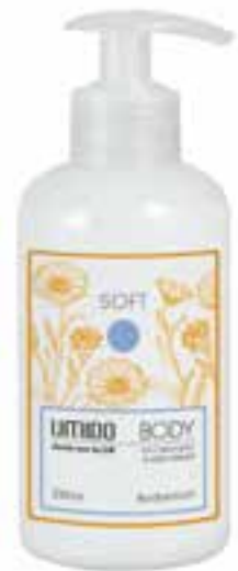
IU-NP-BLS-016 SOFT Bodylotion mit Calendula- & Milch-Extrakt