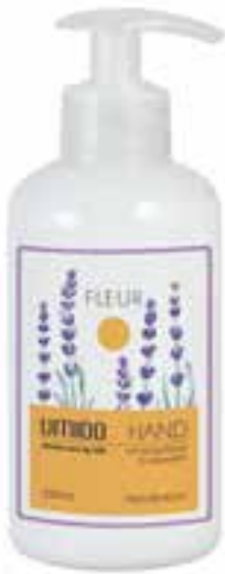
IU-NP-HLS-002 FLEUR Handlotion mit Honig-Extrakt & Lavendelöl