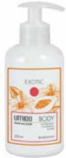
IU-NP-BLS-008 EXOTIC Bodylotion mit Papaya- & Hibiskus-Extrakt