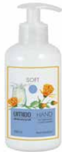
IU-NP-HLS-016 SOFT Handlotion mit Calendula- & Milch-Extrakt