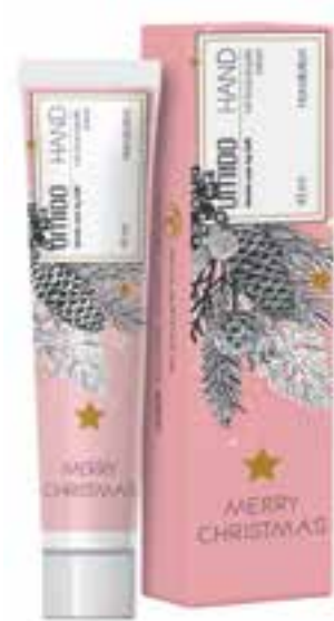
IHL00084 Handlotion mit Granatapfel-Extrakt