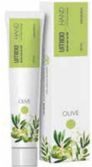
IHL00042 Handlotion mit Oliven-Extrakt