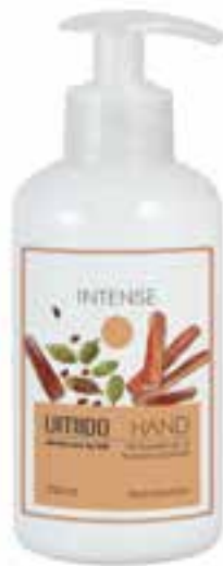
IU-NP-HLS-012 INTENSE Handlotion mit Kardamom- & Sandelholz-Extrakt