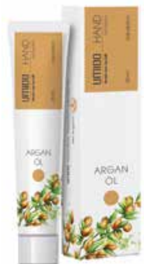
IHL00064 Handlotion mit Arganöl