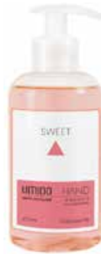
IU-NP-FSS-014 SWEET Flüssigseife mit Mandelöl & Mandel-Extrakt