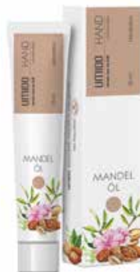
IHL00004 Handlotion mit Mandelöl