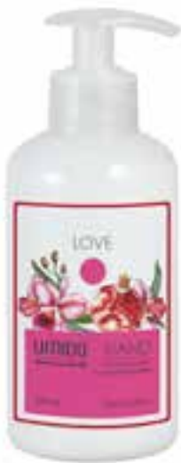
IU-NP-HLS-010 LOVE Handlotion mit Granatapfel- & Orchideen-Extrakt