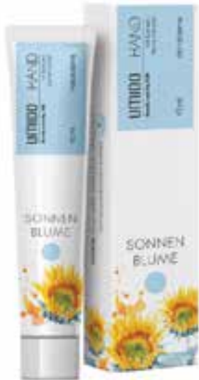
IHL00066 Handlotion mit Sonnenblumen-Extrakt