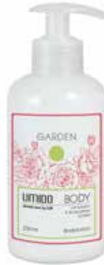
IU-NP-BLS-006 GARDEN Bodylotion mit Rosen- & Rhabarber-Extrakt