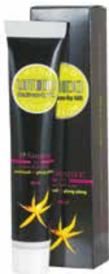
IHL00076 Handlotion mit Patchouliöl & Ylang Ylang-Extrakt