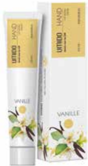
IHL00040 Handlotion mit Vanille-Extrakt