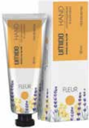
IUHC3002 FLEUR Handcreme mit Honig-Extrakt & Lavendelöl