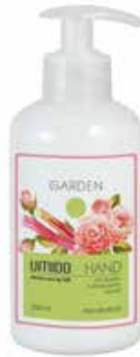
IU-NP-HLS-006 GARDEN Handlotion mit Rosen- & Rhabarber-Extrakt