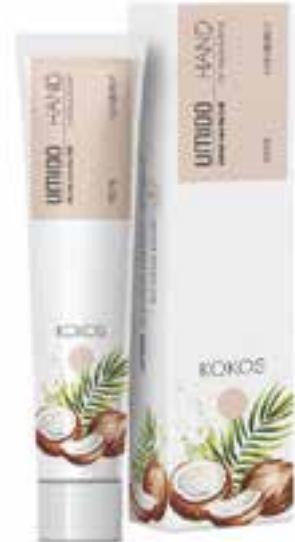
IHL00050 Handlotion mit Kokos-Extrakt