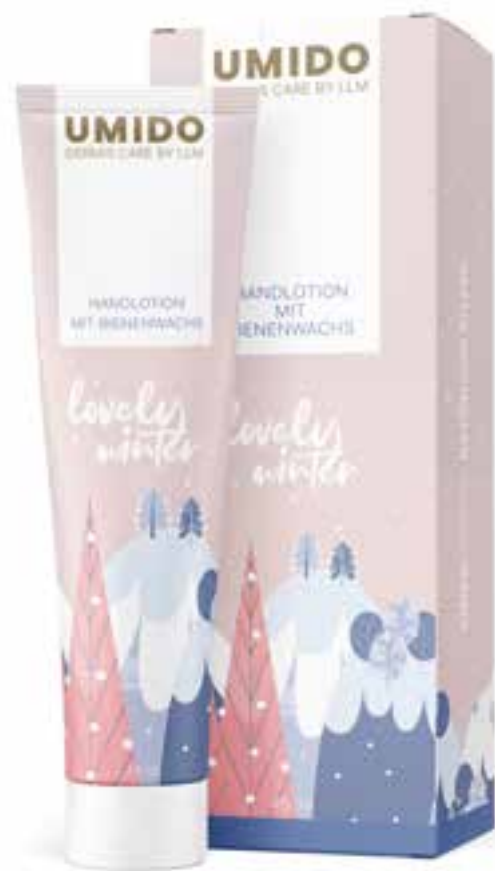
IHL00092 Handlotion mit Bienenwachs