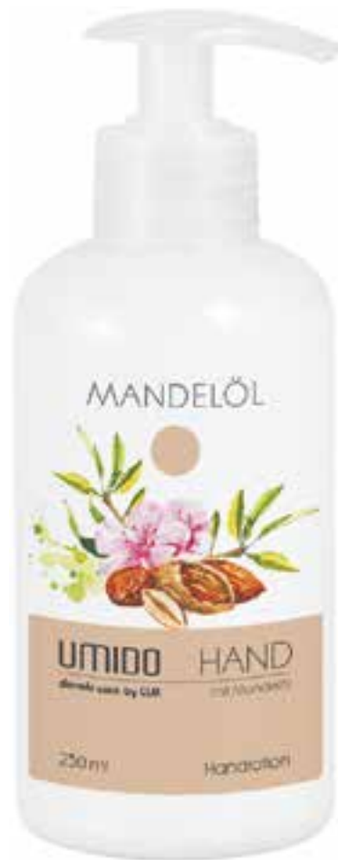
IHLS0016 Handlotion mit Mandelöl