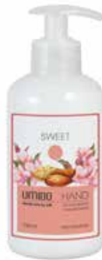
IU-NP-HLS-014 SWEET Handlotion mit Mandelöl & Mandel-Extrakt