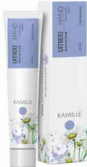
IHL00068 Handlotion mit Kamillen-Extrakt