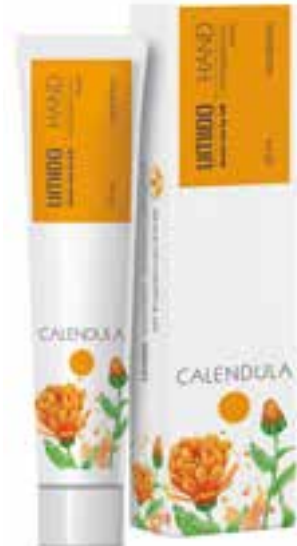
IHL00006 Handlotion mit Ringelblumen-Extrakt