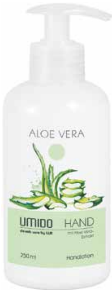
IHLS0014 Handlotion mit Aloe-Vera-Extrakt