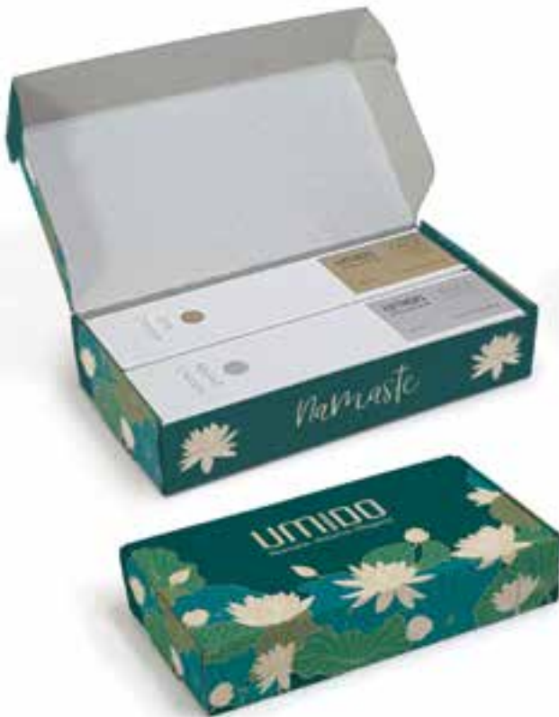
IUGB2022 GESCHENKBOX - LOTUS