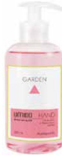
IU-NP-FSS-006 GARDEN Flüssigseife mit Rosen- & Rhabarber-Extrakt