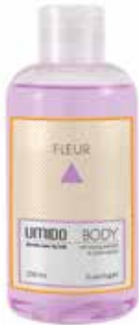
IU-NP-DG-002 FLEUR Duschgel mit Honig-Extrakt & Lavendelöl