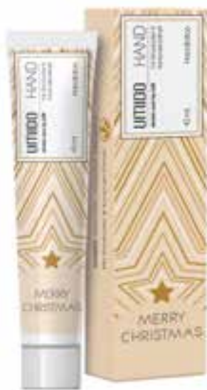
IHL00086 Handlotion mit Koriander-Extrakt & Shea-Butter