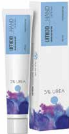
IHL00060 Handcreme mit 5% Urea