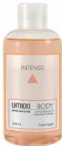
IU-NP-DG-012 INTENSE Duschgel mit Kardamom- & Sandelholz-Extrakt